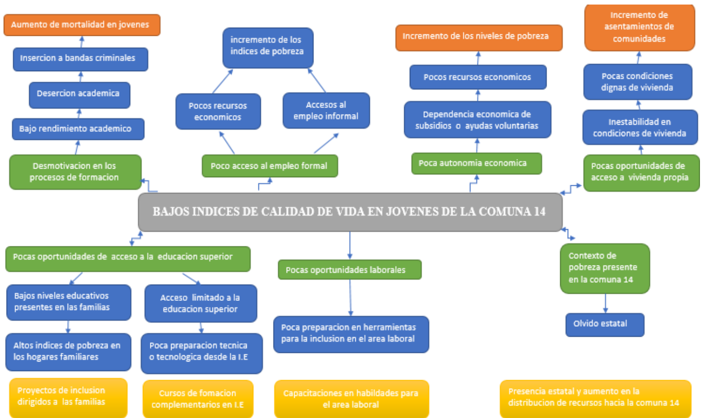
Figura 1 Análisis de Problemas del Proyecto

En la siguiente grafica se puede observar el problema central seguido de sus principales causas en la parte inferior y sus principales efectos que se encuentran en la parte superior de la gráfica. Así mismo, en la última fila del árbol se reflejan algunas posibles alternativas para solucionar el problema.