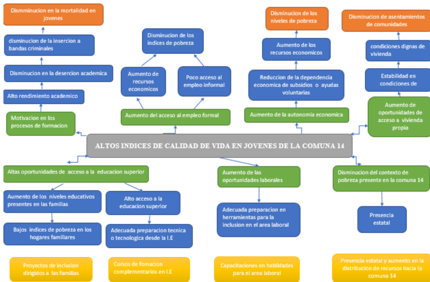
Figura 2 Árbol de Objetivos y Soluciones del Proyecto