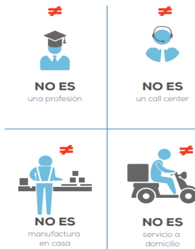
Ilustración 2: ¿Que no es teletrabajo?

Por otro lado, de acuerdo a MinTIC, el teletrabajo tiene unas excepciones y son aquellos trabajadores que habitualmente han sido realizado trabajos por fuera de la empresa, como se puede observar en la ilustración 2.