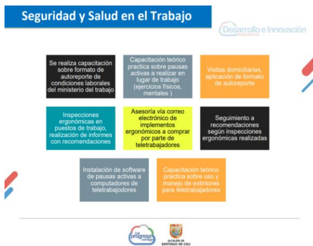
Ilustración SEQ Ilustración \* ARABIC 3: Condiciones de Seguridad y Salud en el Trabajo