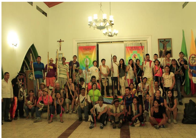
Imagen 9. Guardia de adultos y guardia infantil.