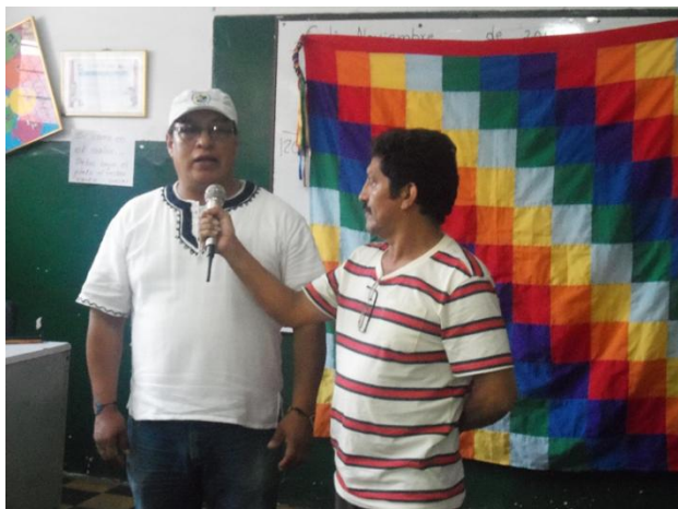
Imagen 5. Migas de pensamiento.