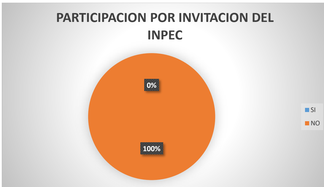
Gráfica 3. Participación por invitación del INPEC