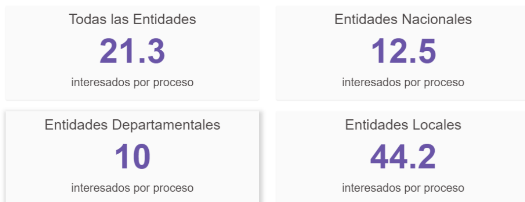
Grafico 3. Resumen de las entidades interesadas en los procesos de contratación 2018

Ahora, otra estadística del año en curso, nos muestra como es la interacción entre los ciudadanos y el estado, a través de la manifestación de interés de participar en los procesos de selección de contratista, en las diferentes modalidades, siendo la Licitación pública, la modalidad de selección en la que más interacción se tiene.