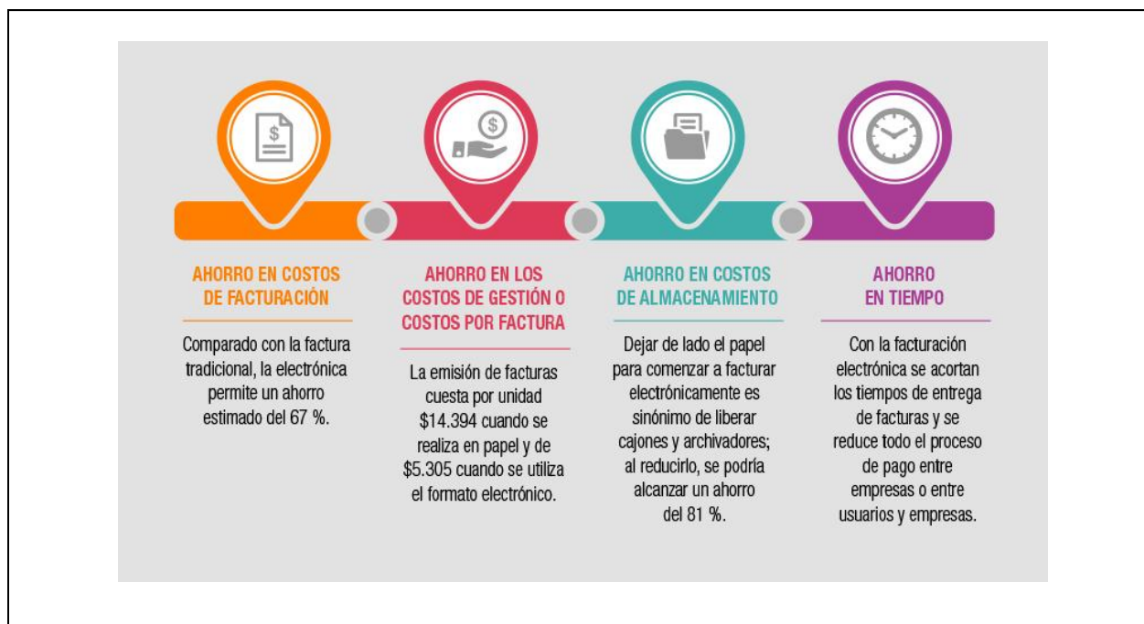
Cuadro 4 Costos de facturación

“Gracias a la factura electrónica se presenta un ahorro en costos de facturación. Comparado con la factura tradicional, la electrónica permite un ahorro estimado del 67 %, ya que se reducen los costos en la manipulación de papel, el recuerdo de los pagos, la gestión de la tesorería, el archivo de los documentos, etc. El paso del papel a lo electrónico supone que los costos estimados para su introducción en los sistemas internos, su validación, gestión de pago, archivo, entre otros procesos se reduzcan drásticamente, permitiendo un ahorro del 65 % de los costos.”