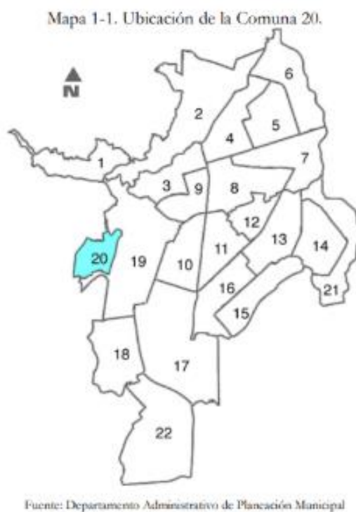
Figura 1: Ubicación de la comuna 20