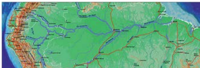
Figura 2. Río Amazonas (CAF, 2004)

En síntesis, la Región Amazónica, históricamente representa un territorio de vital importancia tanto en los niveles nacionales, regional e internacional, que se constituye como un espacio para potencializar las relaciones regionales, promoviendo escenarios de cooperación en materia de comercio transfronterizo, intercambios de tecnología, protección conjunta de los ecosistemas y desarrollo cultural.