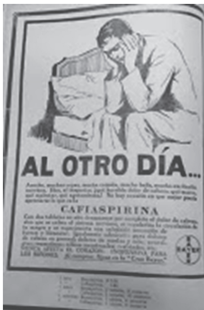
Imagen 2. Cafiaspirina

Los primeros momentos de recolección de información han permitido evidenciar el tema de género dentro de los anuncios publicitarios de las diferentes marcas, como lo muestra la Imagen 2, un aviso de la empresa Bayer para su producto Cafiaspirina, en la cual se ve la imagen de un hombre con dolor de cabeza, y una fuerte carga de texto que brinda indicaciones sobre el uso del medicamento.