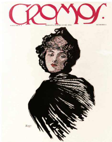
Imagen 1. Primera portada revista Cromos